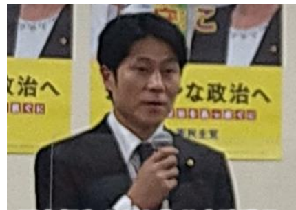
国会報告を行う梅谷衆院議員