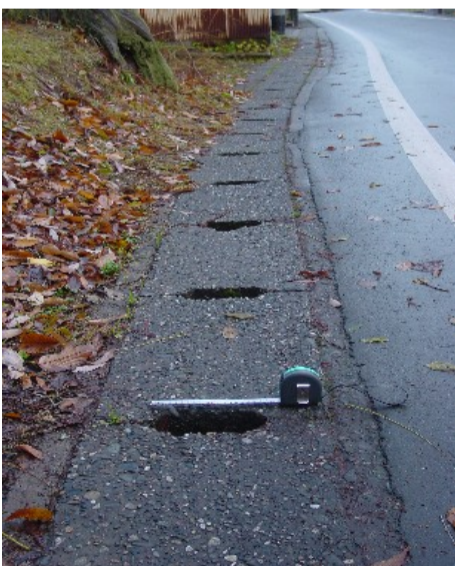
写真はアンケートで改善要望が出された原之町地内の側溝のフタ。縦20センチ、横7センチの穴は危険との指摘をいただきました。

9月にお願ひしたアンケートの整理が遅れて申し訳ございません。ようやく印刷段階までできました。中旬までにはお届けしますので、よろしくお願ひします。