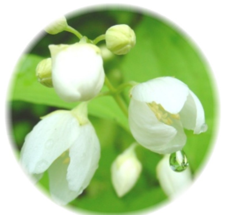
【バイカウツギ】白いタニウツギかと近づいてみたら、この花でした。白がとてもきれいです。下川谷にて1日撮影。

6月定例会は12日から 日程は左表のとおりです。私は12日の午前、総括質疑で登壇することになりました。これもテレビ放映されます。