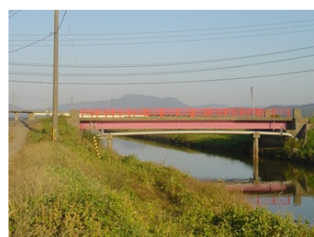
シリーズ 上越市内の橋 第14回 五便橋

「五便橋」と書いて「ごべんばし」と読みます。大潟区蜘蛛ヶ池と頸城区下柳町をつなぐ橋で、湯川にかかっています。橋からは米山、尾神岳、ほくほく線が見えます。近年、この3つをバックに写真を撮る愛好家が増えていそうです。電車の姿も入ると確かにいいですね。橋長はわずか16メートルほど。1966年（昭和41年）3月竣工。