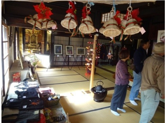
柿崎区上下浜の白壁のある大きな蔵で行われた「蔵の市」へ行ってきました。押し花や各種工芸品などのほか、野菜も出ていて、とても賑やかでした。