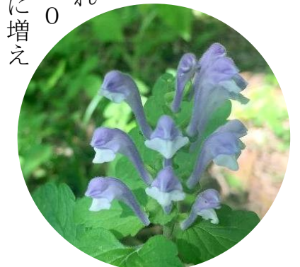
【ツツナミソウ】シソ科の多年草。漢字で「立浪草」と書きます。花は紫色。花が波のように見ることがあります。町内会の草刈りの際、見つけました。花言葉は「私の命を捧げます」。4日、吉川区代石にて撮影。

0mほどのランニングコースなどを備えた鉄骨造2階建の建物を造ろうというのです。総事業費は23億円〜26億円程度で、そのうち、本体工事費は18億円強、設計委託料は7000万円〜80