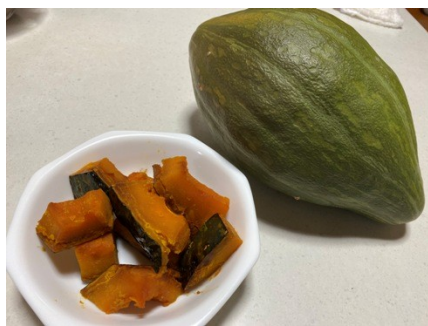
口ロン南瓜。26日、撮影。

日本共産党議員団及び市民クラブは、決議は「令和2年当初からの円滑な実施」を前提にしたものだとして反対しました。当初からの円滑な実施に向け最善を尽くすこと、の2点です。